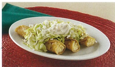
タコスドラドス (チキンとポテトのタコス)

メキシコの主食、トルティーヤに鶏肉などを入れて揚げたもの。パリッとした食感と癖になる美味しさ！