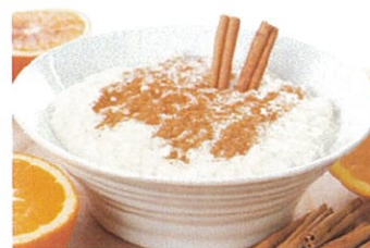
アロス・コン・レチェ (お米のミルクデザート)