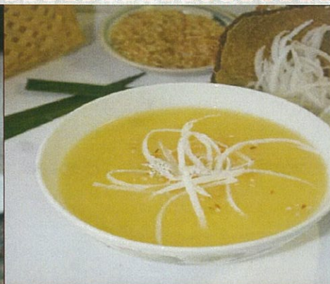
Chè đậu xanh nhuyễn cốt dừa