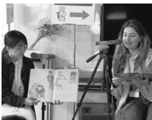
絵本の読み聞かせ