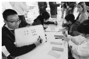
外国の文字で名前を書いてみよう