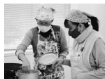
フィリピンのアリシアさん