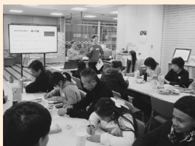
子どもたちから学ぼう！ロシア語

日本語ひろばで勉強する子どもたちやその家族9名、ボランティア12名が集まり、初めての交流会をリファーレ2階KIEFひろばで開催しました。学習後、みんなでお昼を一緒に食べてゲームをしたり、「子どもたちから学ぼう！」と題して出身国のあいさつを覚えてもらったりしました。普段は日本語を勉強している子どもたちが先生となり、日本語で一生懸命説明してくれる姿が頼もしかったです。支援者と学習者という立場が逆になったことで、ボランティアの皆さんも「外国語を勉強することの難しさがわかった」と頑張っている子どもたちの気持ちを改めて実感できたようです。